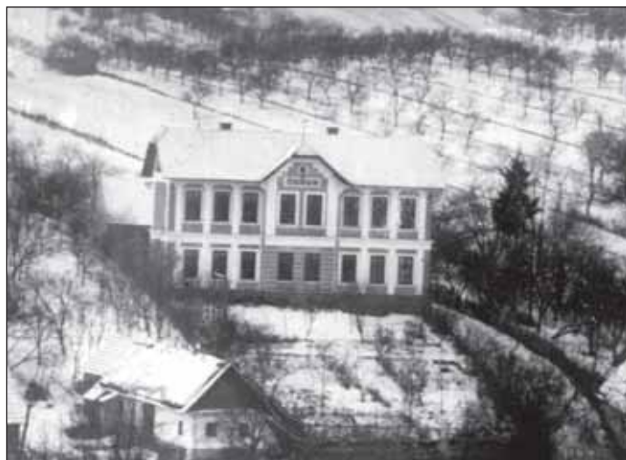
Fotografie nevšovské školy z roku 1909

Na realizaci této investiční akce se nám podařilo získat dotaci ze státního rozpočtu ve výši 3,6 mil. Kč. Předpokládané náklady na stavbu jsou však mnohem vyšší. Vzhledem k tomu, že v současné době probíhá výběrové řízení na dodavatele stavby, přesná částka zatím není známa. Bude k dispozici po ukončení výběrového řízení. Předpokládaný termín dokončení stavby je v závěru příštího roku. I když akci teprve zahajujeme a její podoba je pouze v projektové dokumentaci, mohou lidé, kteří se