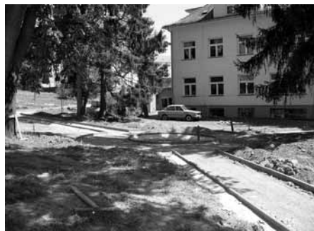
Nově vznikající městský park před Horákovou vilou