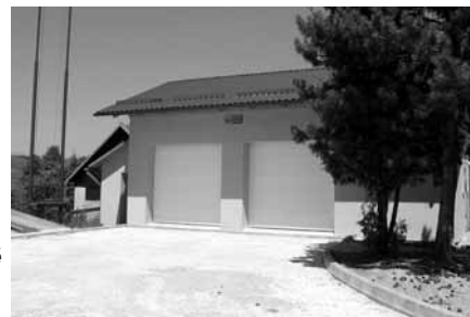
Oprava místní komunikace před nově opravenou hasičskou zbrojnicí v Divnicích