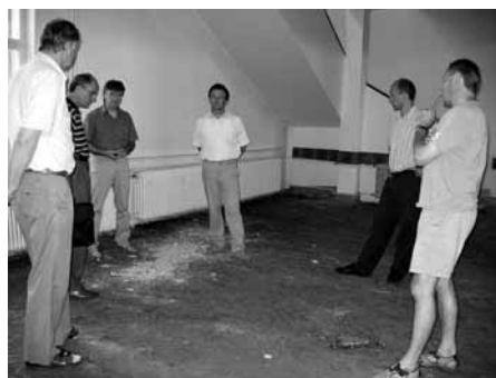
Členové rady města při rozhodování o způsobu opravy podlahy v Sokolovně