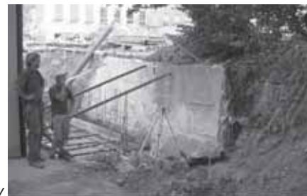
Rekonstrukce ZŠ Vlára - budování opěrné zídky